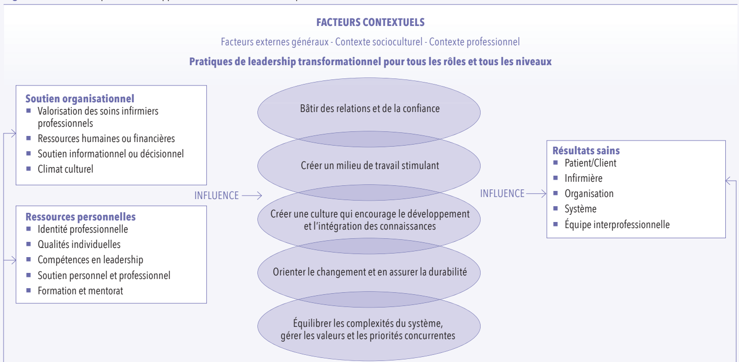
Figure 2. Modèle conceptuel du développement et maintien du leadership infirmier

Source : Figure tirée et adaptée de Registered Nurses' Association of Ontario (RNAO) (13)