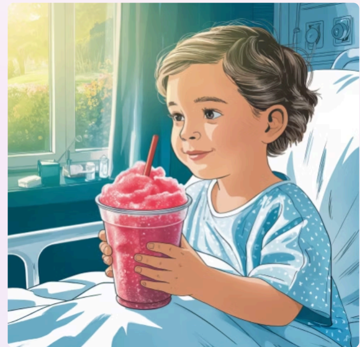
Les certificats et la SLUSH